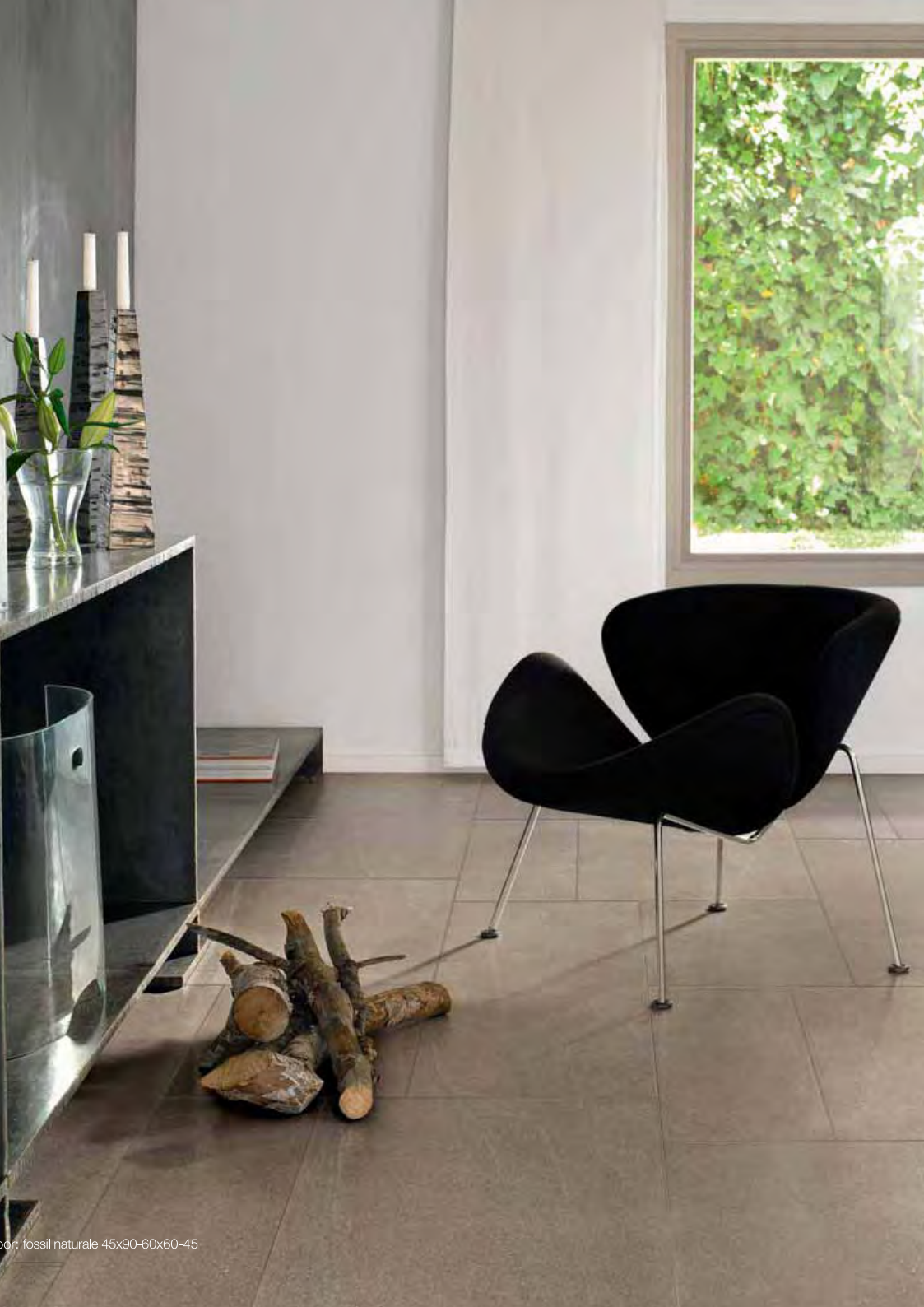
por. fossil naturale 45x90-60x60-45