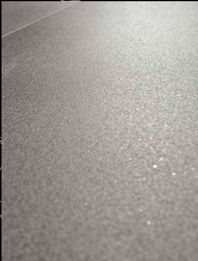
floor: mud 60x60 naturale / 23 5 / 8 "x23 5 / 8 " matte